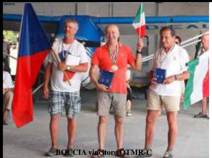
BOCCIA vincitore OTMR-C