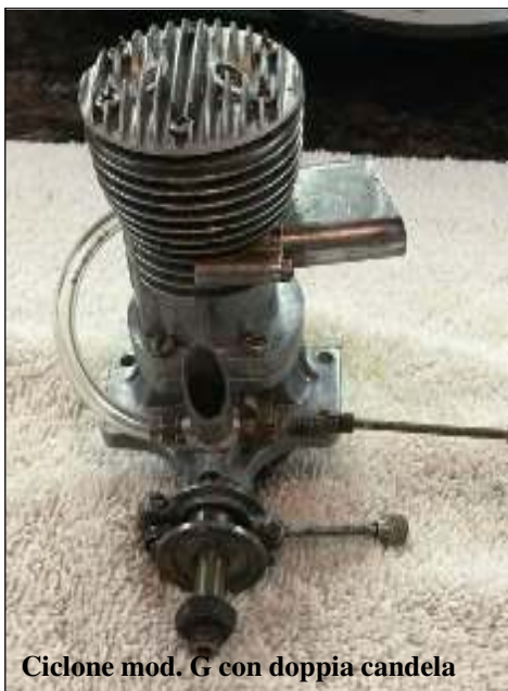
Ciclone mod. G con doppia candela