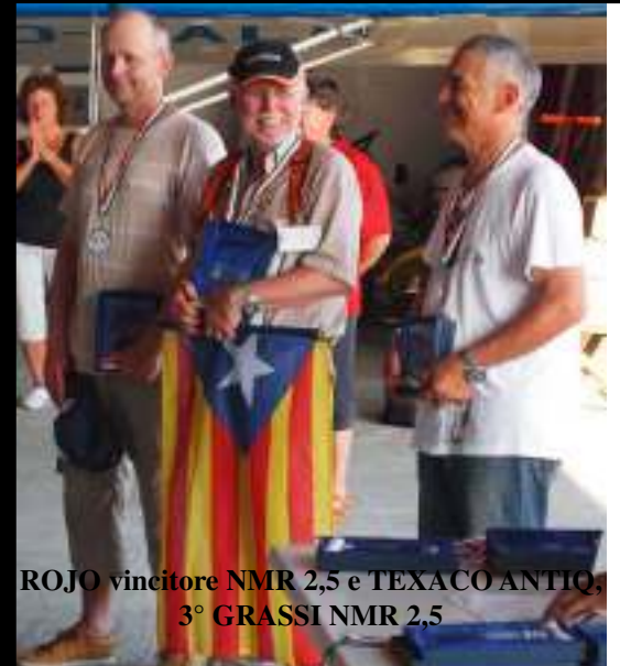
ROJO vincitore NMR 2,5 e TEXACO ANTIQ, 3° GRASSI NMR 2,5