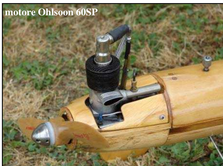
motore Ohlsoon 60SP