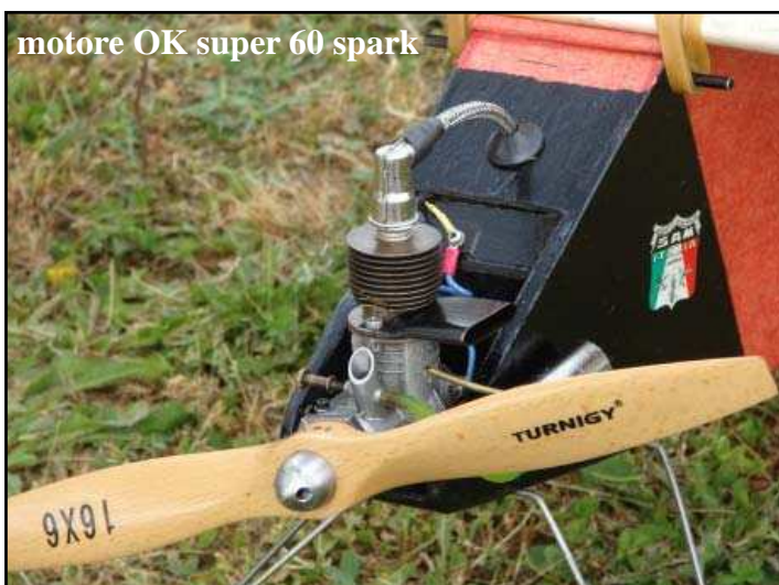
motore OK super 60 spark