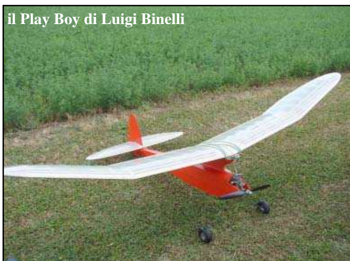
il Play Boy di Luigi Binelli