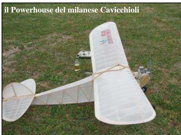
il Powerhouse del milanese Cavicchioli