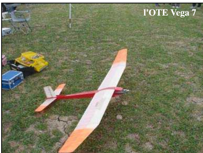
l'OTE Vega 7