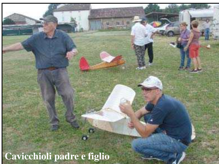
Cavicchioli padre e figlio