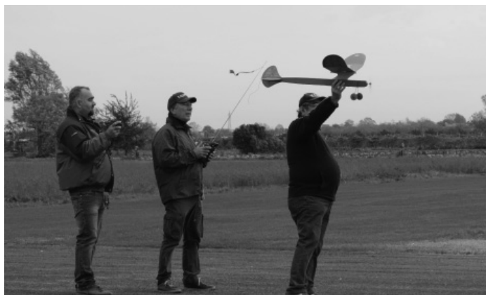
Sami al lancio