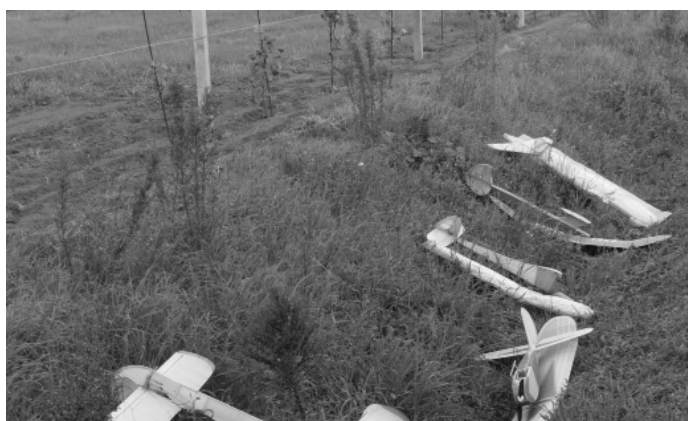
...per metterli nel fosso...