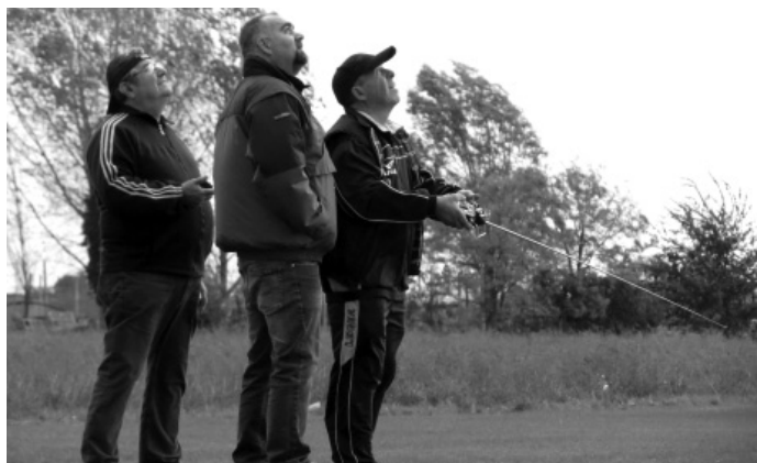
Magnani in lotta col vento