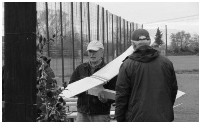
Si montano i modelli...