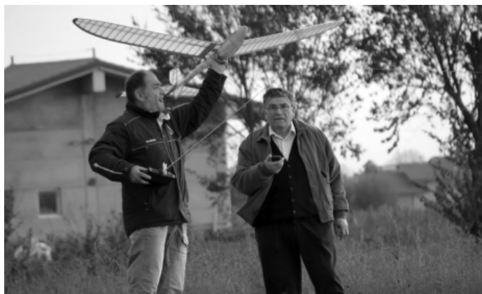
Baldinini al cavo di traino