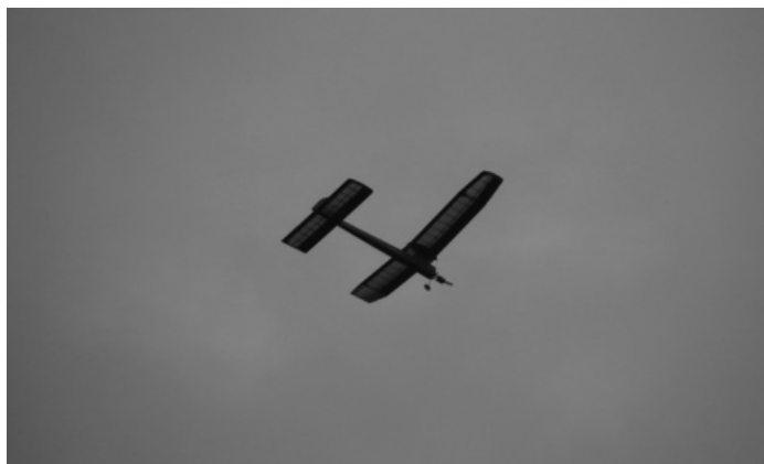
Il Mini Hogan di Fabbri