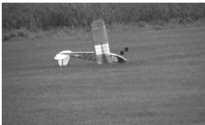
Il vento ha avuto la meglio