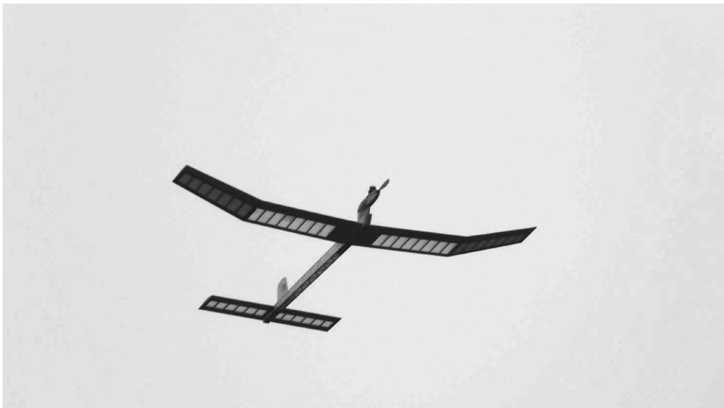
Hammerhead in planata