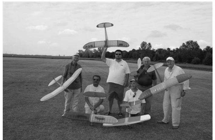
Memorial Frank Ehling postal