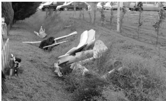
...al riparo dal vento